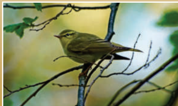
Waldlaubsänger im Heiligenwald