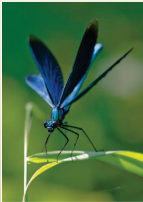
Männliche Prachtlibelle im Weipersgrund

Das von der AGNU seit 10 Jahren im Weipersgrund verfolgte Pflege- und Entwicklungskonzept mit seinen Vernäsungsmaßnahmen und Gewässerrenaturierungsergebnissen, führt zum mittlerweile größten dokumentierten Vorkommen der wunderschönen blauen Prachtlibellen in Mittel- wie Südhessen.