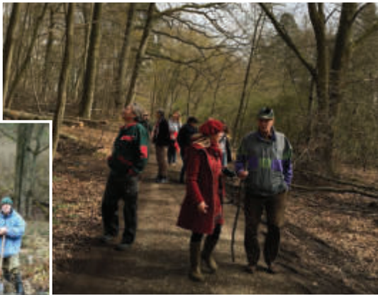
Arbeitseinsatz | Wanderung Heiligenwald