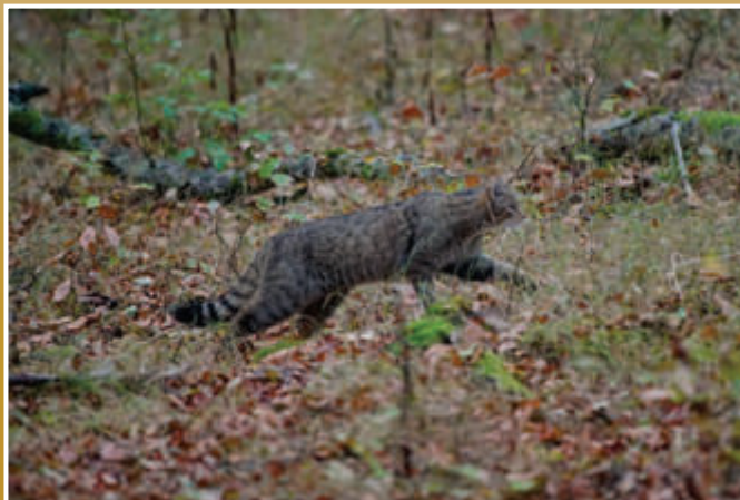
Wildkatze im Heiligenwald

Das von der AGNU seit 10 Jahren im Weipersgrund verfolgte Pflege- und Entwicklungskonzept mit seinen Vernäsungsmaßnahmen und Gewässerrenaturierungsergebnissen, führt zum mittlerweile größten dokumentierten Vorkommen der wunderschönen blauen Prachtlibellen in Mittel- wie Südhessen.