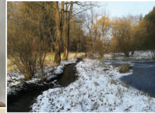
Winter im Weipersgrund