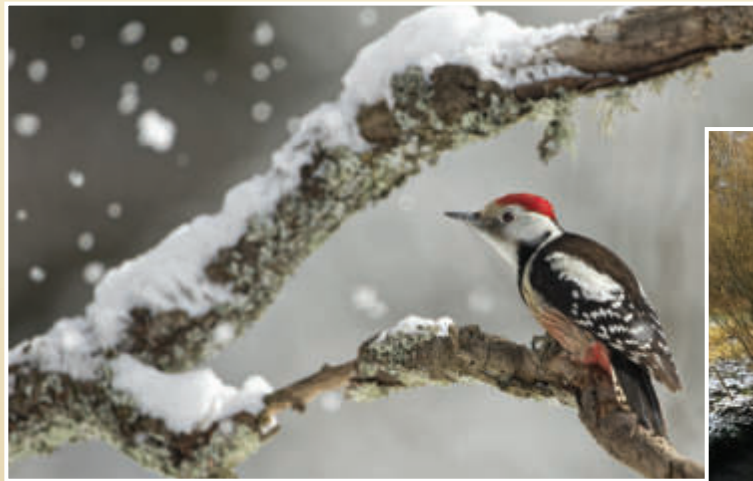
Mittelspecht bei Breitenbach