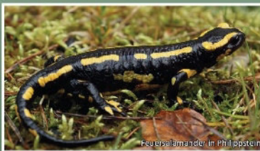
Feuersalamander in Philippstein