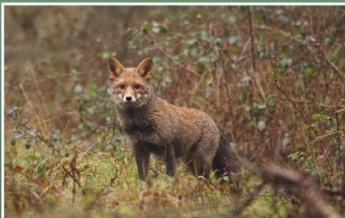
Fuchs in der Kirschbach in Philippstein

Die Kirschbachwiesen bei Philippstein haben sich im Sinne des Naturschutzes und der Artenvielfalt unter Einfluß der AGNU wundervoll entwickelt. In den trocknen, östlichen Hanglagen herrscht mittlerweile eine begeisternde Insektenvielfalt, die Ihres gleichen sucht. Auch die unteren feuchten Bereiche entwickeln sich gut. Zur Förderung der heimischen Reptilienfauna (Zauneidechse, Blindschleiche, Schlingnatter) werden Stein- und Holzhaufen im Verlauf dieses Jahres angelegt. Ein kleiner Teich soll unterhalb im Gelände entstehen.