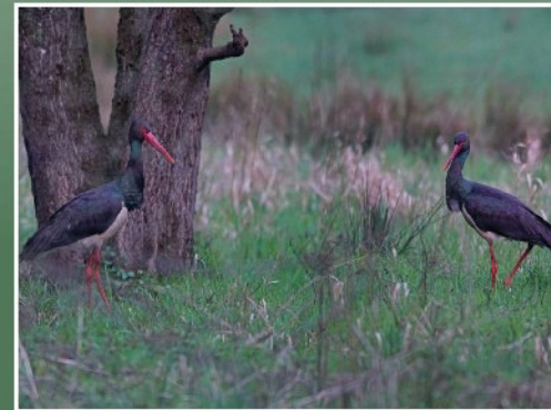
Schwarzstörche im Weipersgrund

Thema: Naturbilder und Plaudereien - Rund um den Naturschutz und die Natur in der Region. AGNU Jahresabschluss mit dem befreundeten Naturschützer und Topnaturfotografen Helmut Weller Treffpunkt: Café Tiergarten Braunfels (Tiergartenstraße hinauf bis zum Parkplatz am Café), Großer Saal Leitung: Helmut Weller