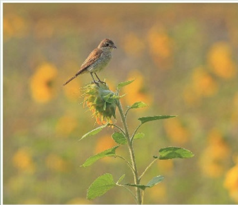
Neuntöter auf Blühfläche

Die Kirschbachwiesen bei Philippstein haben sich im Sinne des Naturschutzes und der Artenvielfalt unter Einfluß der AGNU wundervoll entwickelt. In den trocknen, östlichen Hanglagen herrscht mittlerweile eine begeisternde Insektenvielfalt, die Ihres gleichen sucht. Auch die unteren feuchten Bereiche entwickeln sich gut. Zur Förderung der heimischen Reptilienfauna (Zauneidechse, Blindschleiche, Schlingnatter) werden Stein- und Holzhaufen im Verlauf dieses Jahres angelegt. Ein kleiner Teich soll unterhalb im Gelände entstehen.